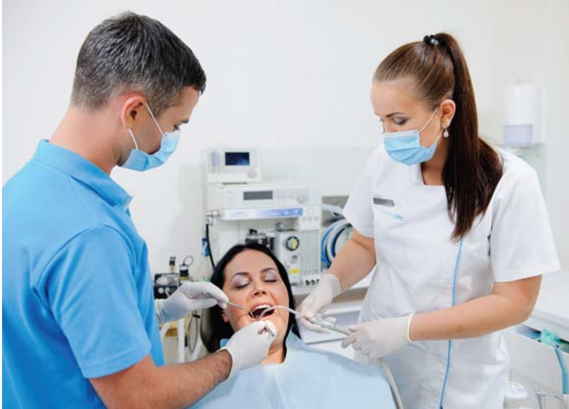
MALO CLINIC | DPC klinikoje naudojami implantai, kuriais dantis galima atkurti vos per vieną dieną.

Ką darytumėte netekę priekinio danties? Tikriausiai, kuo skubiau kreiptumėtės į odontologą, kad greičiau jį atkurtų. Pirmiausia – dėl išvaizdos. Tačiau netekę kurio nors krūminio danties per daug neskubate vietoj jo įstatyti naujo, nes juk nesimato, o kramtyti irgi galite. Odontologai įspėja: dantų trūkumas – nėra tik estetinė problema, nes uždelsus gali tapti rimtu sveikatos sutrikimu ir nemažu psichologiniu išbandymu.