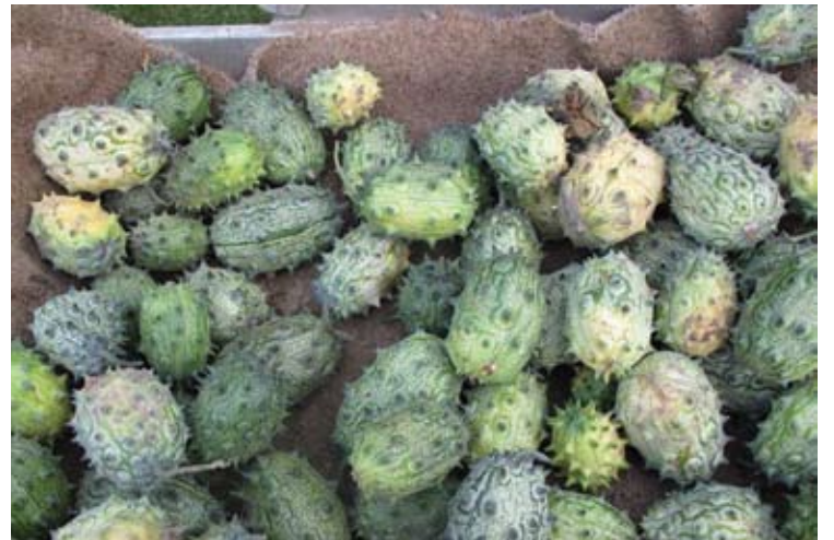
Šiemet klaibūniečiai pasisėjo egzotiškųjų kivanų, kilusių iš Afrikos. Jie dar vadinami „raguotaisiais melionais“.

Mėgstamiausių moliūgų pavadinimo P.Krivickienė teigė negalinti prisiminti, bet jie žalios spalvos ir, anot moters, yra vadinami ananasiniais. Pernai šios daržovės buvo užderėjusios ypač didelės, jomis buvo susidomėjusi ir viena didžiųjų Lietuvos televizijų. „Pernai daug lijo, o toje vietoje, kur augo moliūgai, buvo už-