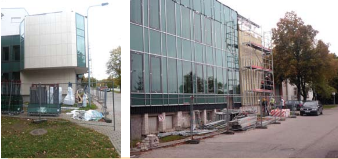
Dalis fasado jau sutvarkyta – toji, kuri labiausiai matosi žmonėms. Kita Kultūros centro pusė tvarkoma dabar.

Anykščių kultūros centro renovacijos darbus galima pavadinti amžiaus statybomis. Renovacija, prasidėjusi 2008-aisiais ir jau kainavusi per 4 mln. eurų, vis dar tęsiasi ir neaišku, kada baigsis.